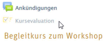
Abbildung 3 : LTI-Aktivität «EvaSys» eingebettet auf der Kursseite