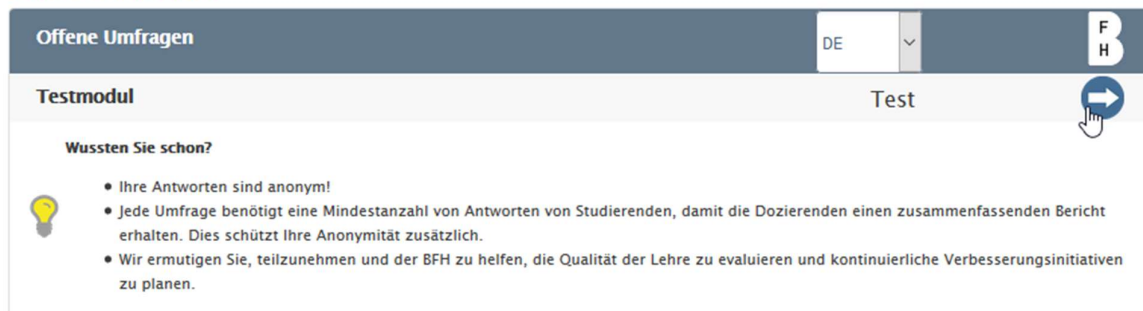
Abbildung 4: LTI-Aktivität «EvaSys» in Moodle